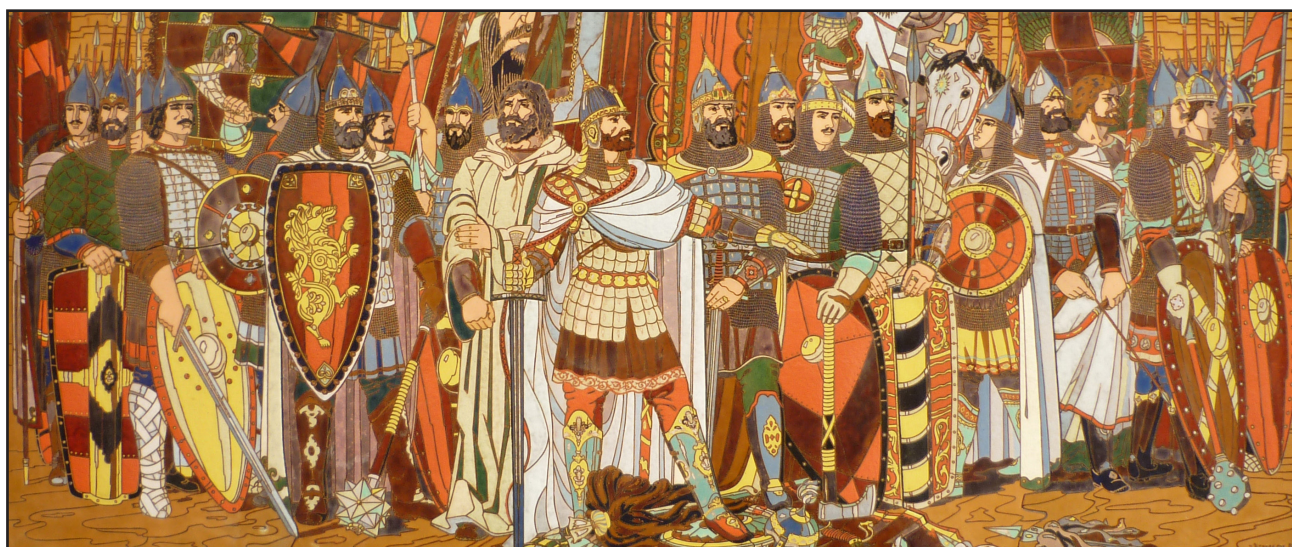
Куликовская битва. 1380. 1984

Для каждой работы характерна особая символическая цветовая гамма. В «Куликовской битве» — это золото и красный цвет победы, доставшейся кровью. Многоцветье панно «Бородино» символизирует многонациональное и всенародное российское воинство в 1812 году, всю гамму объединяет победоносный золотистый фон.