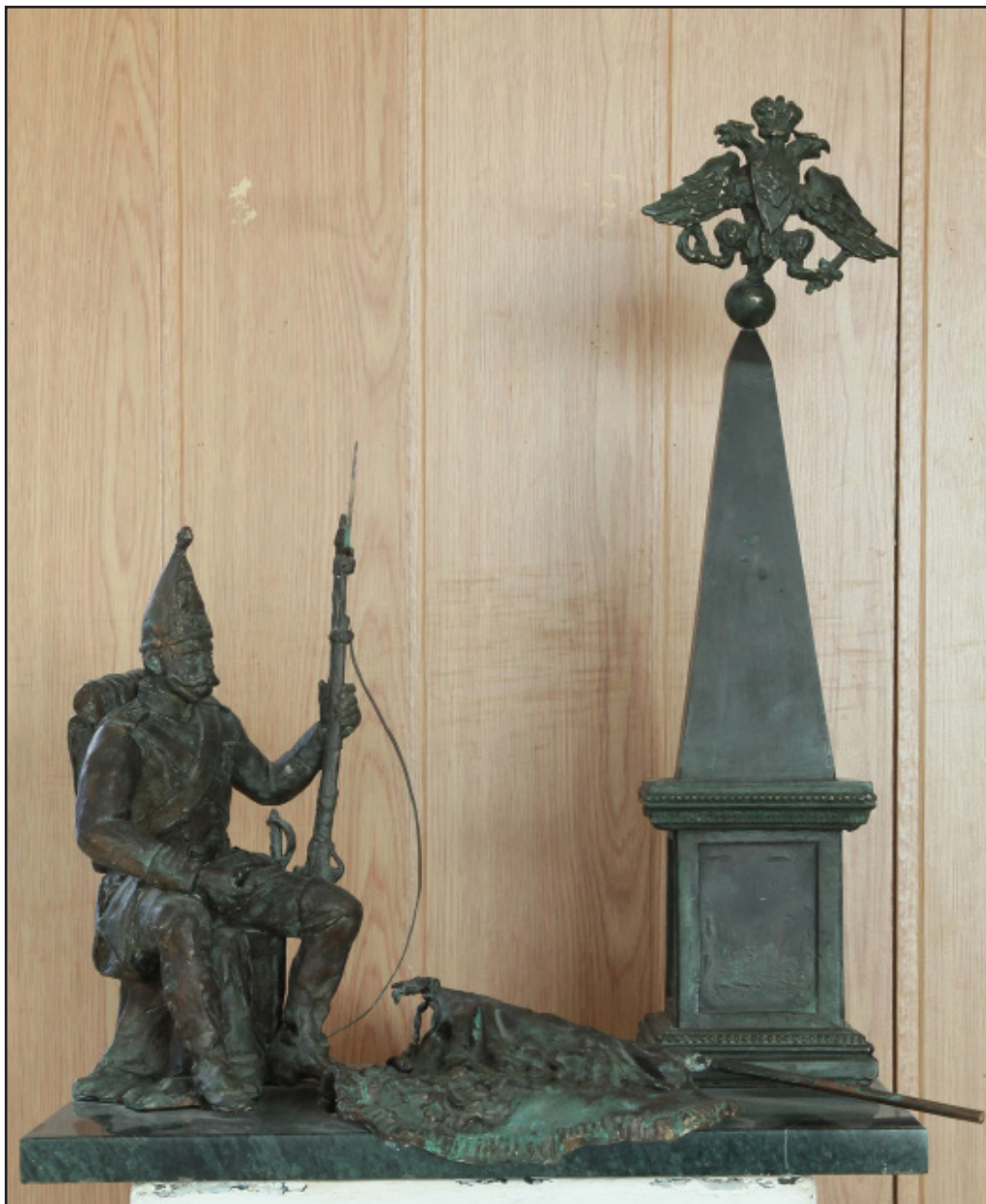
Таратынов А.М. Гренадер. 2007 Бронза

Гренадеры – отборные части пехоты и/или кавалерии, изначально предназначенные для штурма вражеских укреплений, преимущественно в осадных операциях. Гренадеры были вооружены огнестрельным оружием и ручными гранатами, которые раньше называли «гренадами» или «гренадками». От гранад и пошло название подразделений, использующих этот вид оружия. Впоследствии гренадерами стали называть отборные части тяжелой пехоты.