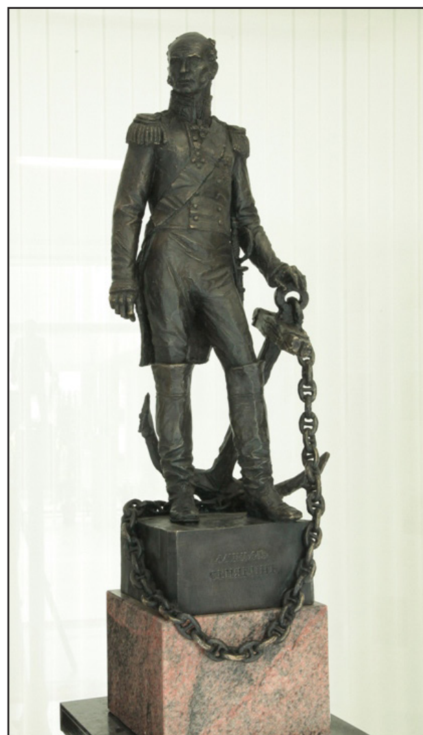
Переяславец М.В. Адмирал Д. Сенявин. 2012 Бронза, гранит

Он реорганизовал армию по европейскому образцу и создал Российский флот как боеспособную единицу вооруженных сил страны, не уступающую передовым мировым стандартам своего времени. На счету Петра I много ярких боевых побед, расширивших территориальные границы России и обеспечивших ее выход к Балтийскому морю. Он основал Северную столицу России – Санкт-Петербург.