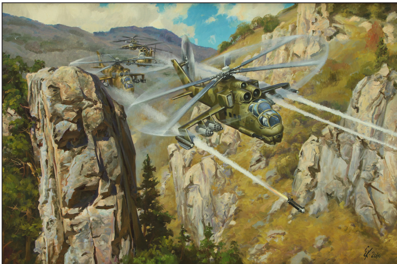
Корнеев Е.А. Вертолет Ми-24. 2010 Холст, масло. 100x150

Ми-24 (по классификации НАТО англ. Hind) — советский транспортно-боевой вертолет разработки ОКБ М.Л. Миля. Стал первым советским и вторым в мире (после АН-1 «Кобра») специализированным боевым вертолетом. Серийный выпуск начался в 1971 году. Имеет множество модификаций, экспортировался во многие страны мира. Активно использовался в годы Афганской войны, в период боевых действий в Чечне, а также во многих региональных конфликтах. Производится на ОАО «Роствертол».