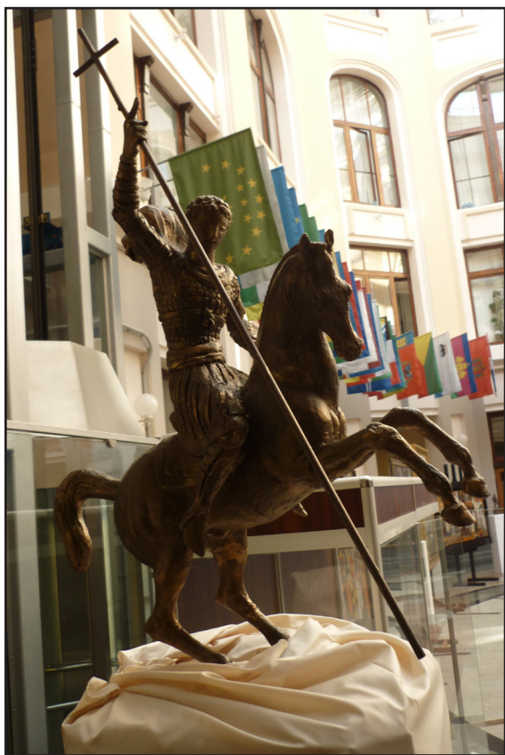
Святой Георгий Победоносец. Бронза