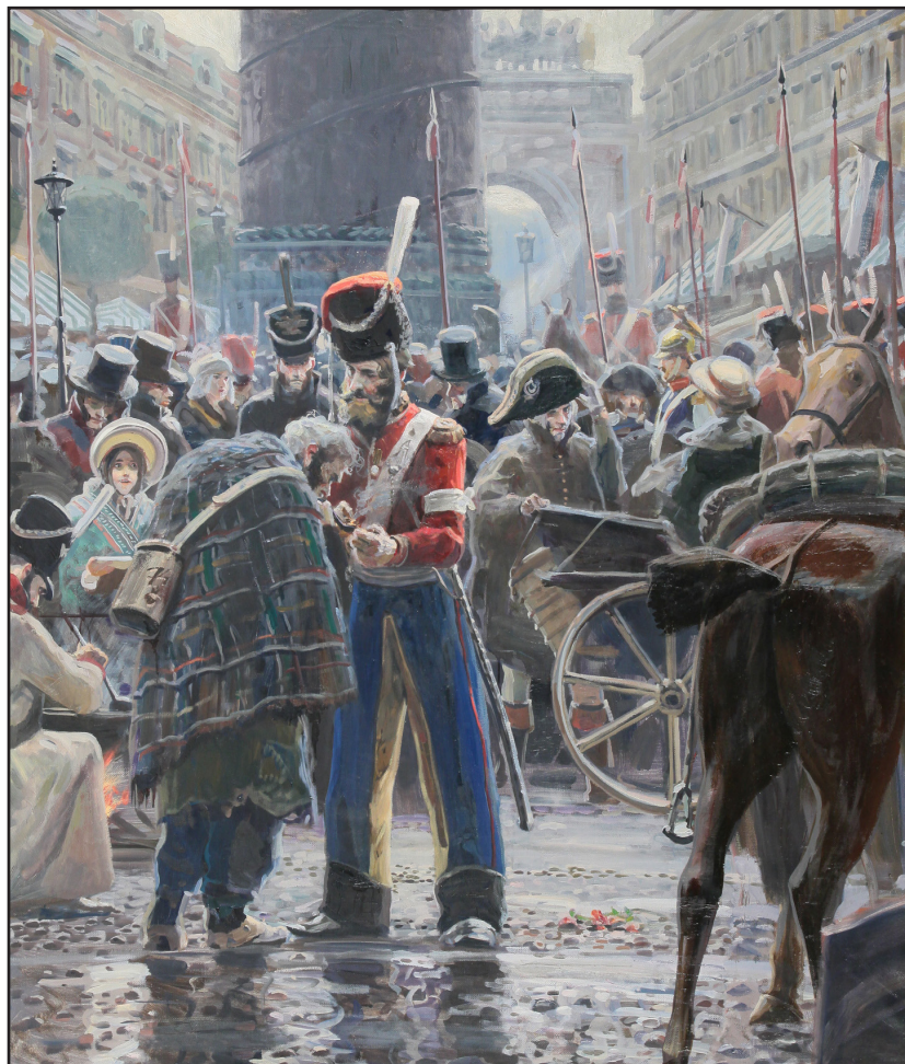
Рыженко П.В. Париж. 1813 год. 2008 Холст, масло. 129x108

Отечественная война 1812 года стала одной из героических страниц в истории донского казачества. В военных действиях участвовали 40 полков, входивших в состав русской армии еще до начала войны, и 26 полков казачьего ополчения, сформированных на Дону.