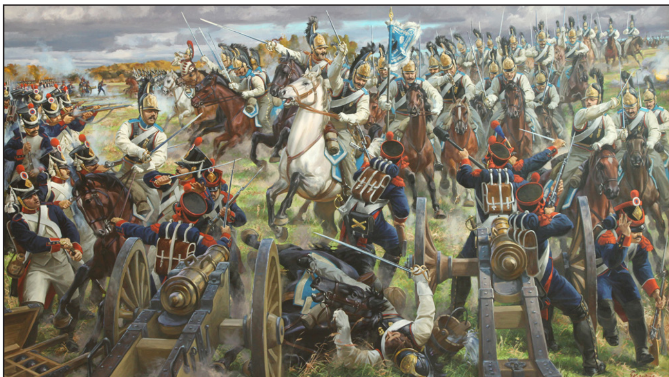
Корнеев Е.А. Кирасиры Его Величества. 2009 Холст, масло. 200х350

Лейб-гвардии Кирасирский Ее Величества полк – гвардейский полк тяжелой кавалерии, один из старейших и наиболее прославленных кавалерийских полков российской императорской гвардии.