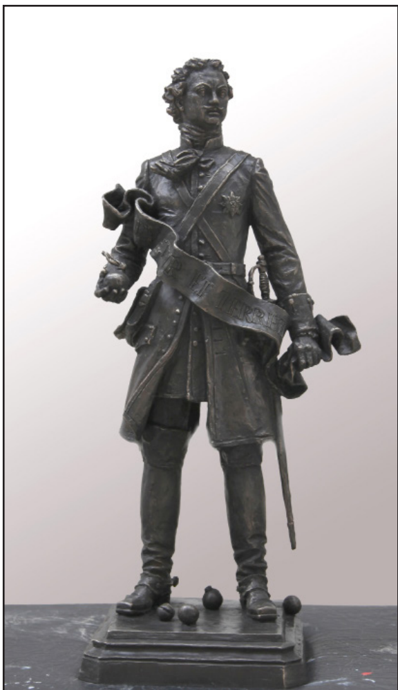
Переяславец М.В. Петр I Великий. 2012 Гипс

Петр I Великий внес большой вклад в укрепление российского государства и его защиту от иноземных врагов.