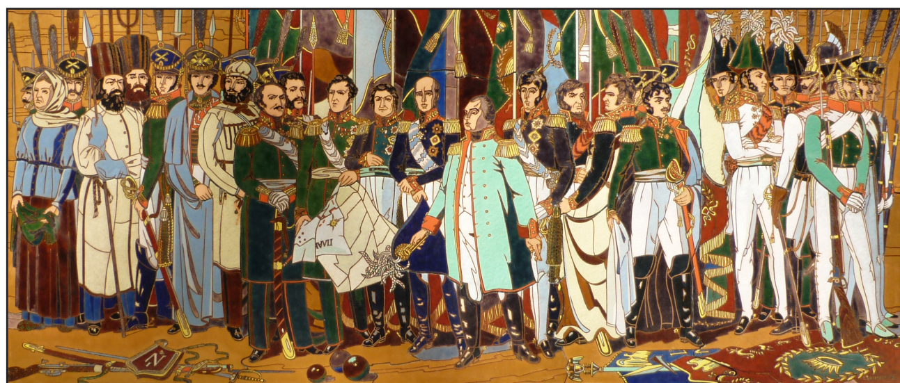
Бородино. 1812. 1984