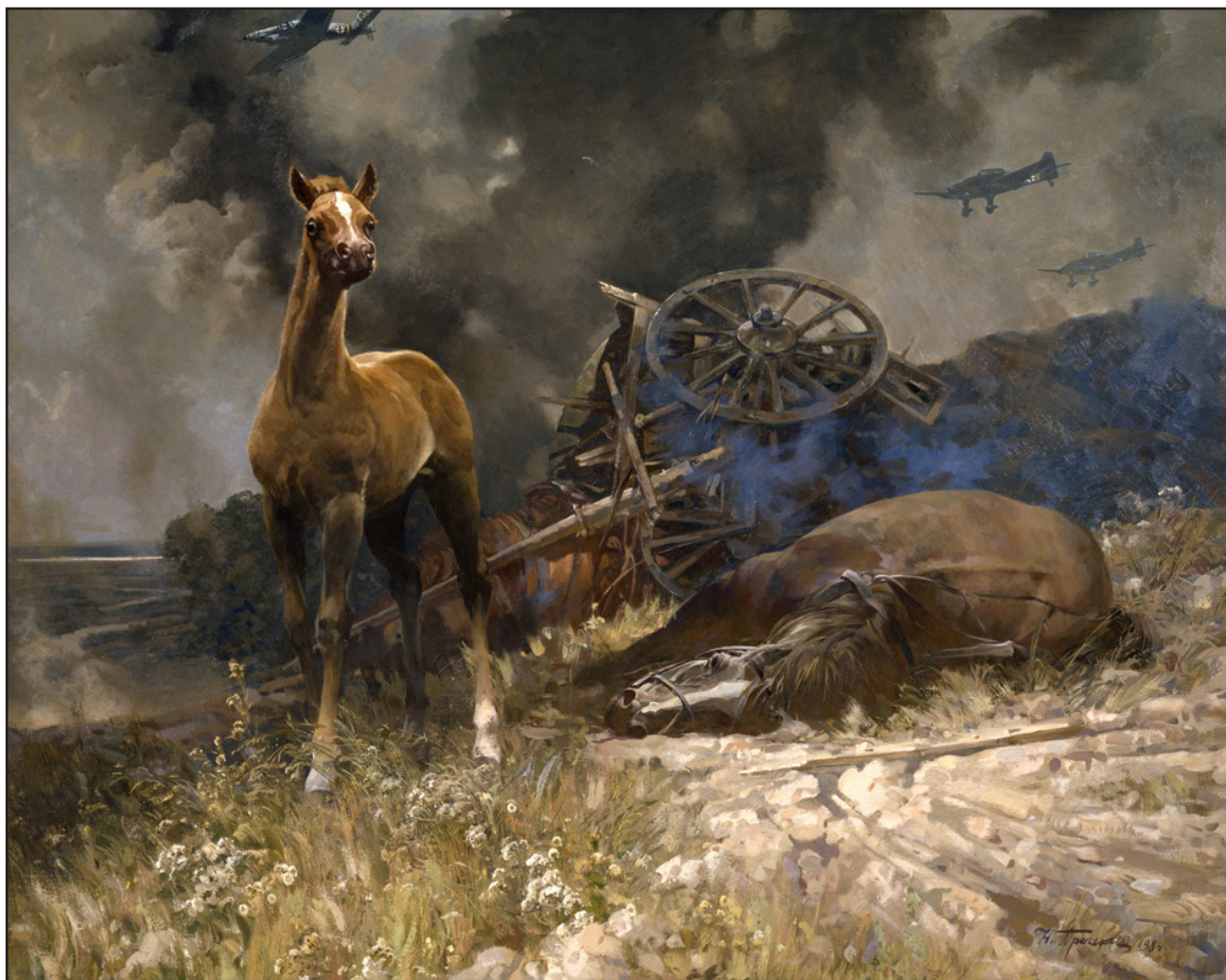
Присекин С.Н. Лихолетье. 1984 Холст, масло. 135х175

И на фронте, и в тылу живописцы создавали художественную летопись Великой Отечественной войны, писали по горячим следам сражений. Эскизы, наброски, графические листы, сделанные на полях сражений, нередко воплощались в монументальные батальные полотна.