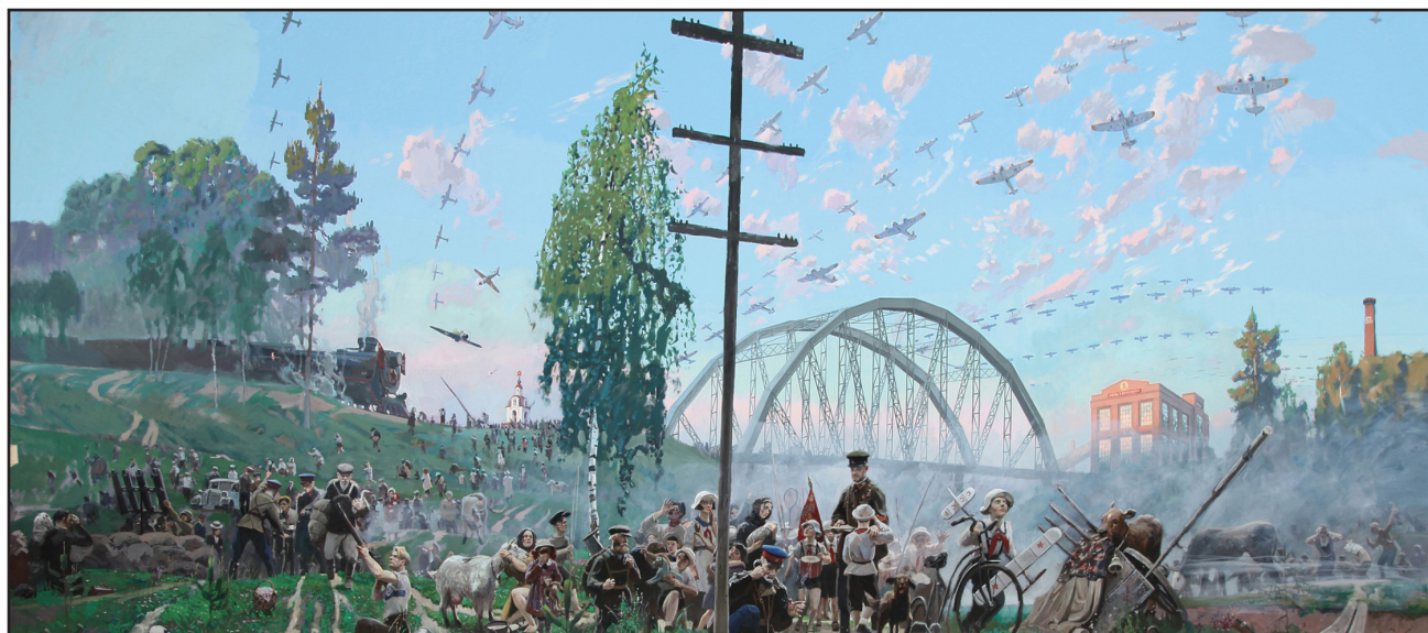
Рыженко П.В. Диорама «Начало войны 1941 года». 2011 (экспонируется впервые)

Утром 22 июня 1941 года московское радио передавало обычные воскресные передачи и мирную музыку, но в полдень граждане Советского союза услышали сообщение от заместителя председателя Совета народных комиссаров Союза ССР и народного комиссара иностранных дел товарища В.М. Молотова: