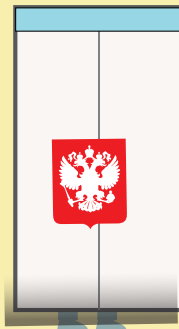
кабины для голосования и иные специально оборудованные места для тайного голосования

Фото- и видеосъемка не должны нарушать тайну голосования, поэтому запрещается снимать - заполненные избирательные бюллетени до начала подсчета голосов - персональные данные, внесенные в список избирателей