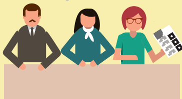
места выдачи избирательных бюллетеней