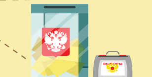
ящики для голосования, технические средства подсчета голосов (если они используются)