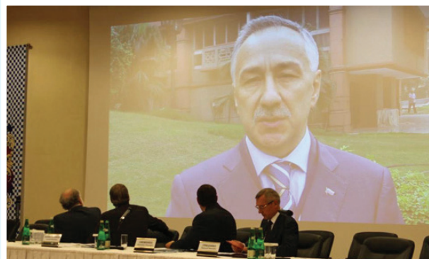
На фото: трансляция видеообращения заместителя Председателя ЦИК России С.В. Вавилова из Дели (Индия) на Всероссийском совещании в г. Сочи

В ходе работы Генеральной Ассамблеи Азиатской ассоциации избирательных органов еще одним важным мероприятием явилось видеообращение заместителя Председателя ЦИК России С.В. Вавилова к участникам Всероссийского совещания председателей избирательных комиссий субъектов Российской Федерации, которое проходило в Сочи 30 октября 2014 года.