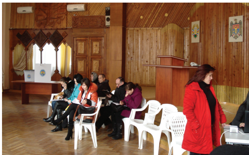
Наблюдатели от политических партий на избирательном участке

Ненадежность компьютерной системы могла также стать причиной возникновения конфликтных ситуаций. Российские наблюдатели стали свидетелями конкретного случая, когда пришедшей на участок (участок № 21 г. Бельцы) женщине было