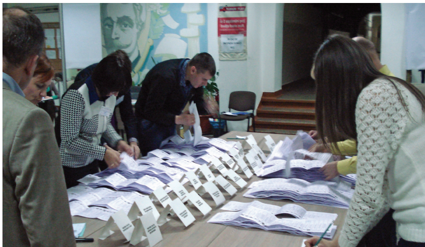
Поиск фамилий избирателей в государственном регистре

ленного использования партией средств из-за рубежа. Однако в данном случае партия не использовала зарубежные средства.